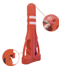
Système de verrouillage Locking system