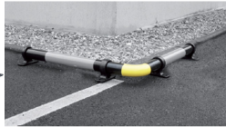
Coude disponible en option ref PARKKORNER2SB